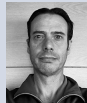
Ing. Jorge Castaingts Drone Solutions SAS